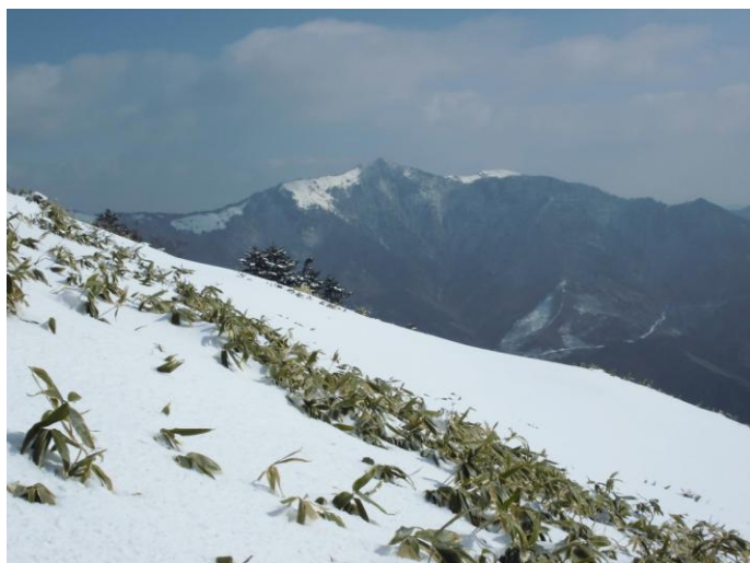
▲ 稜線からの平家平方面